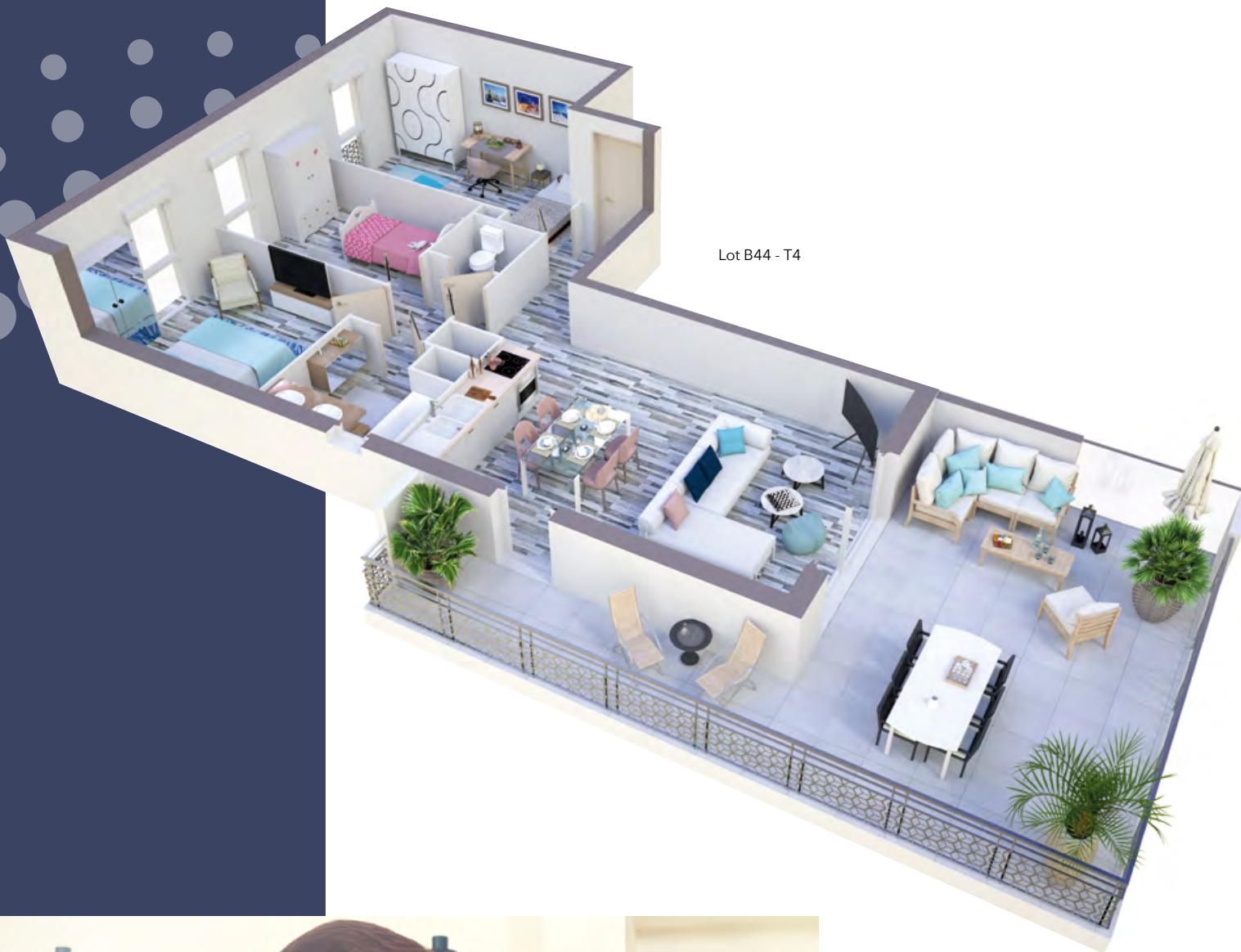
Lot B44 - T4