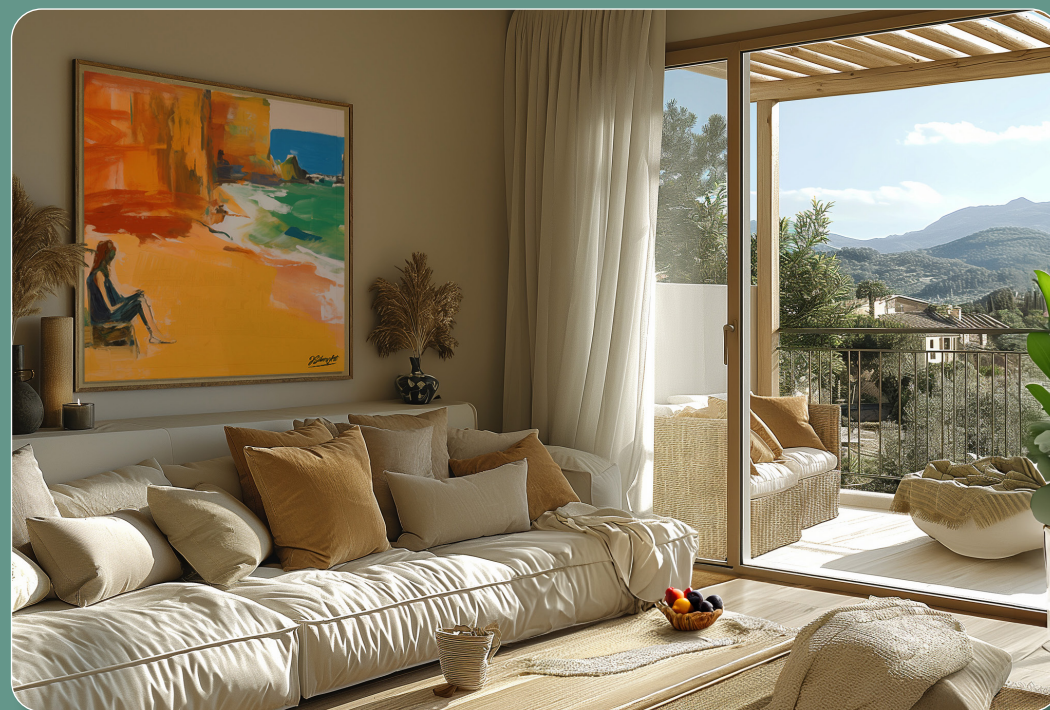
EXEMPLE DE VUE DU SÉJOUR