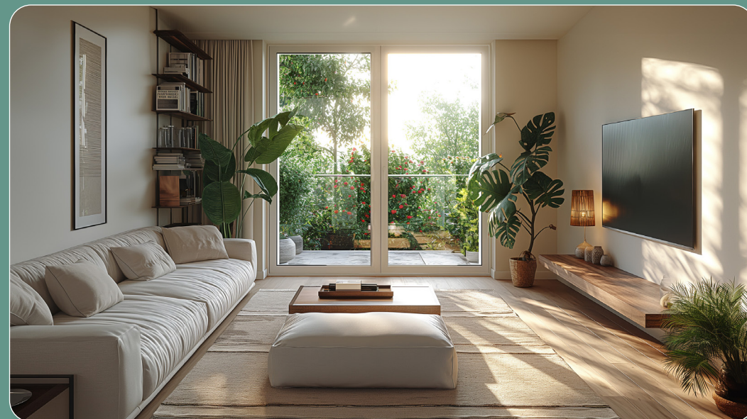
EXEMPLE DE VUE DU SÉJOUR