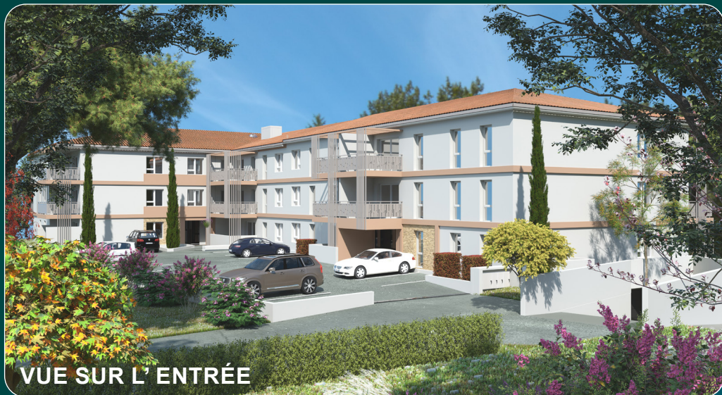
VUE SUR L'ENTRÉE